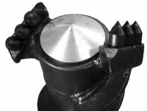
буровая коронка с резами