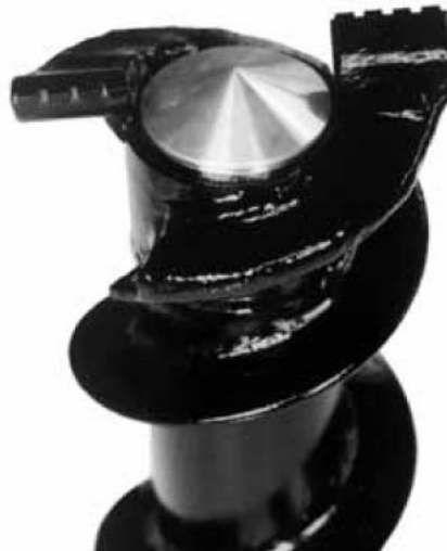
буровая коронка с плоскими зубцами